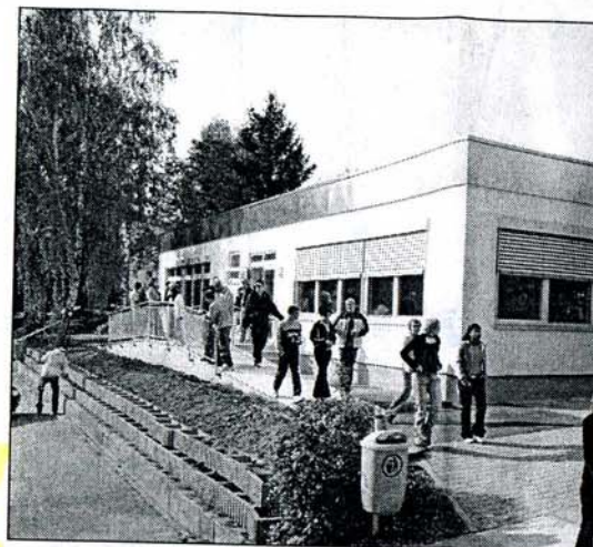
318 000 Euro kostete der Pavillon der Eppinger Grundschule (oben). Der Neubau bietet Platz für vier Kl

Unter Federführung der Heilbronner Firma Koch und Mayer sowie des Eppinger Architekten Gunter Schwarz wurde Anfang Juni mit der Maßnahme begonnen. Die Arbeiten schritten so zügig voran, das schon jetzt die Einweihung des Pavillons (15,42 x 22,80 Meter) vor der Tür steht. Vier Klassenzimmer mit einer Fläche von jeweils 62 Quadratmeter, ein Sanitärtrakt und eine eigene Heizungstherme sind darin untergebracht. Errichtet wurde der Anbau der Grund-, Haupt- und Werkrealschule Eppingen in Holzrahmenbauweise. Dabei wurden die Stahlträger als tragende Bauteile verwendet. Zudem ist die Statik so gewählt worden, dass – im Falle weiteren Platzbedarfs – eine spätere Aufstockung jederzeit möglich ist. (kü)